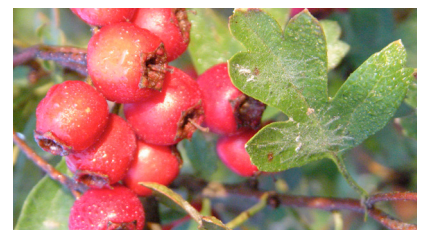
Crataegus (Weißdorn) – stärkende Unterstützung