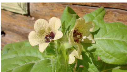
Hyoscyamus (Bilsenkraut) – rhythmischer Taktgeber