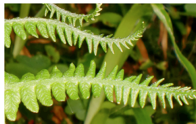
zottenähnliche Struktur des Wurmfarms

Schleimhautdefekte regenerieren sich mit einer Heilpflanzenkombination aus Farnen und Weiden. Diese entwicklungs-geschichtlich sehr alten Heilpflanzen sind im feuchten Milieu beheimatet und zeichnen sich durch extreme Vitalität aus. Sie bringen wieder neues Leben in den „Wertstoffhof“ des Körpers.