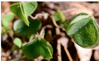
Sauerklee, ein lichtscheuer Zeitgenosse

Auch Säuglinge können betroffen sein, wenn sich der, bis zur Geburt keimfreie Darm, fehlbesiedelt. Eine gezielte Stuhl Diagnostik kann helfen, Problemen auf die Spur zu kommen.